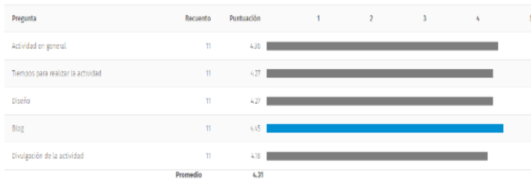
Figura 4. Evaluación de cada ítem.

actividad, ambos obtuvieron un 4.27; la divulgación de la actividad, un 4.18; y el blog que fue creado para divulgar los videos de la actividad, un 4.45.