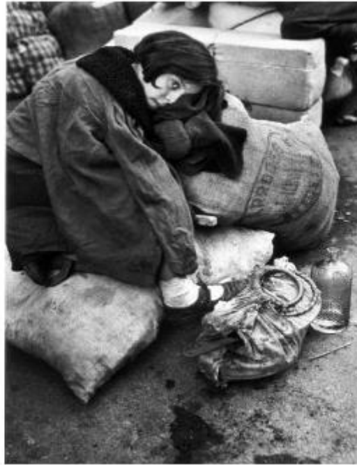
Hacia el exilio, (1939) de Robert Capa. Barcelona.