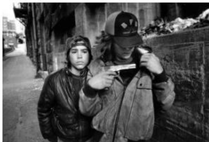
Criados por lobos, (2016) de Mary Ellen Mark