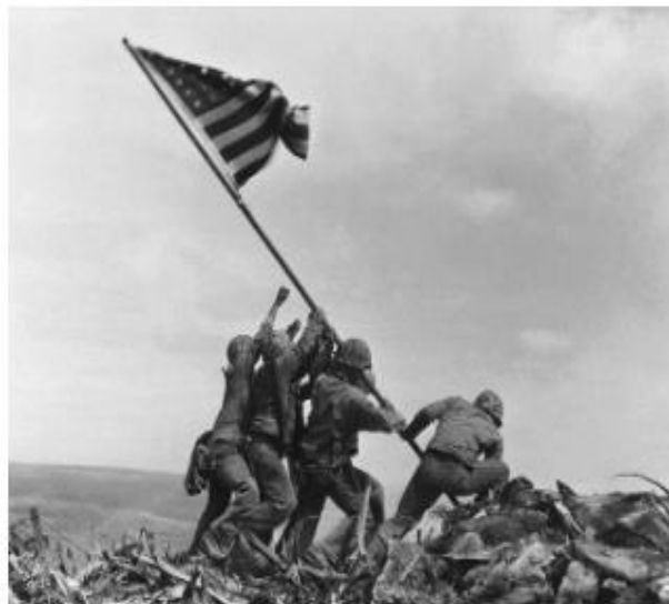
Imagen 4 Rising the fly on Iwo Jima

Joe Rosenthal. (1945) Rising the fly on Iwo Jima. Los marines levantan la bandera estadounidense sobre el punto más elevado de Iwo Jima. (1945). Premio Pulitzer.