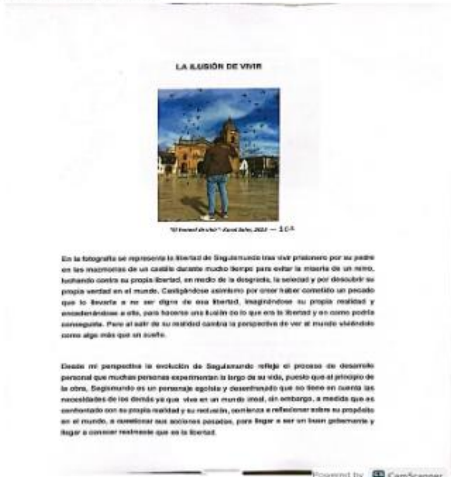
Imagen 6 La ilusión de vivir

La ilusión de vivir. Karol Soler. (2023). 10º.