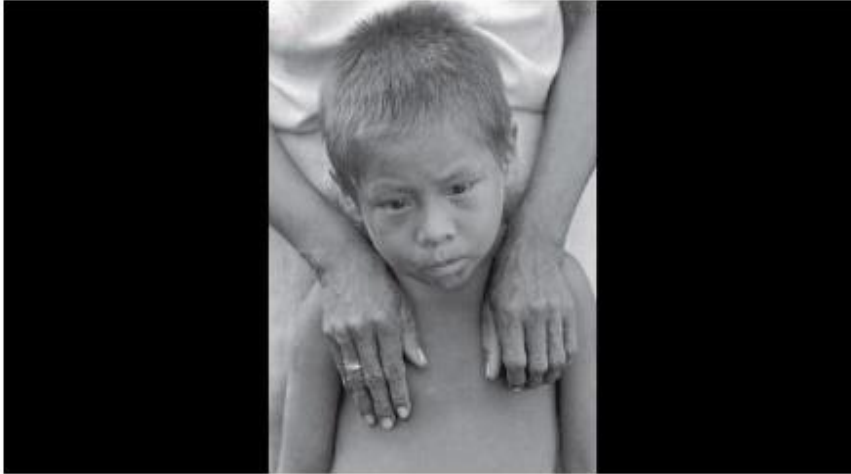
Imagen 3 Centro Nacional de Memoria Histórica

Desplazamiento por combates entre la guerrilla de las FARC y el Ejército en la Operación Génesis. (2001). Jesús Abad Colorado.